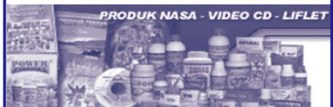
PRODUK NASA - VIDEO CD - LIFLET