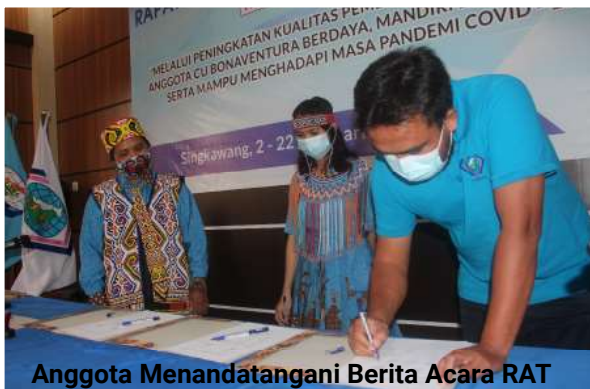
Anggota Menandatangani Berita Acara RAT