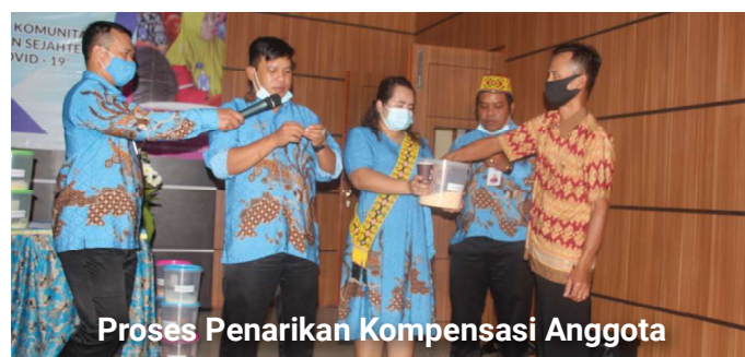
Proses Penarikan Kompensasi Anggota

4.5. Meskipun RAT Tahun Buku 2020 dilaksanakan secara tertulis, tetapi pengumuman dan penarikan undian kompensasi tetap dilaksanakan secara transparan dan akuntabel. Proses penarikan undian direkam dalam bentuk video dan dapat diakses oleh anggota melalui akun resmi CU Bonaventura.