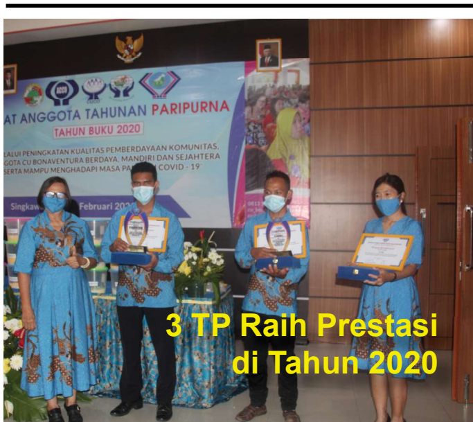
3 TP Raih Prestasi di Tahun 2020

Pada puncak acara RAT Paripurna CU Bonaventura 22 Februari 2021 lalu, CU Bonaventura memberi penghargaan kepada Tempat Pelayanan berprestasi. Penghargaan diberikan kepada manajemen Tempat Pelayanan sebagai motivasi tetap bersemangat mengembangkan CU Bonaventura.