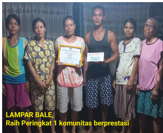
LAMPAR BALE, Raih Peringkat 1 komunitas berprestasi

CU Bonaventura tidak hanya memberi kompensasi bagi anggota pribadi, ada pula penghargaan bagi Komunitas Pemberdayaan yang berprestasi. Pemberian kompensasi bagi komunitas berprestasi dilakukan dengan penilaian oleh tim bidang Diklat dan Pemberdayaan.