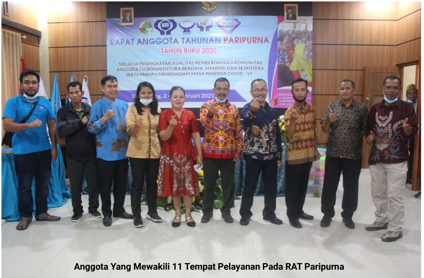
Anggota Yang Mewakili 11 Tempat Pelayanan Pada RAT Paripurna