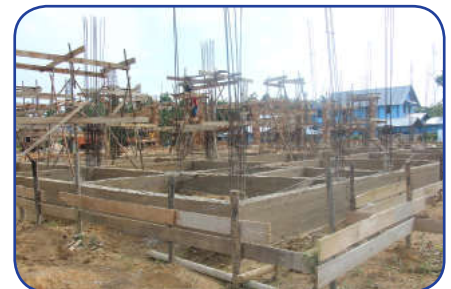
Kondisi Bangunan 25% tanggal 18 Februari 2016