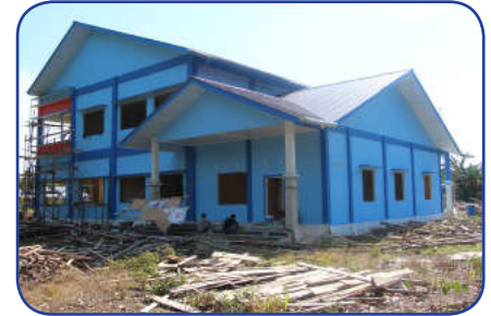
Kondisi Bangunan 80% tanggal 30 September 2016