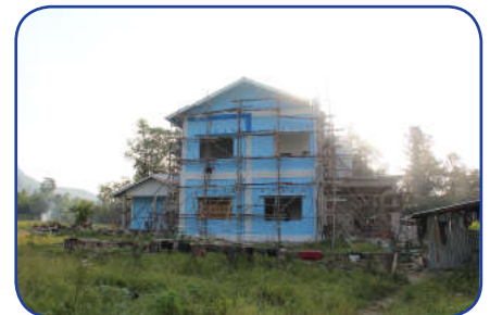
Kondisi Bangunan 75% tanggal 29 Agustus 2016