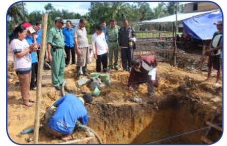
Ritual Adat tanggal 29 November 2015 dan Peletakan Batu Pertama tanggal 21 Desember 2015