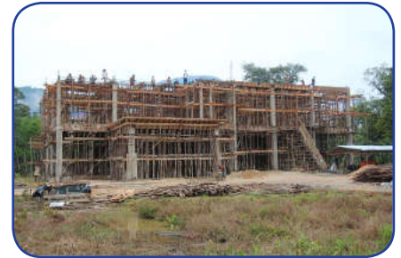
Kondisi Bangunan 35% tanggal 26 April 2016