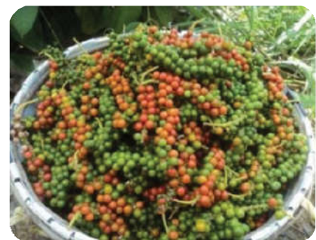
Hasil Panen Buah Lada

Cara pemanenan cukup dengan mematahkan bagian ruas pada tangkai buah lada dengan tangan. Buah lada akan dapat terus produktif pada usia 8 – 10 tahun kedepan, tergantung jenis varietas yang anda tanam dan cara perawatannya.