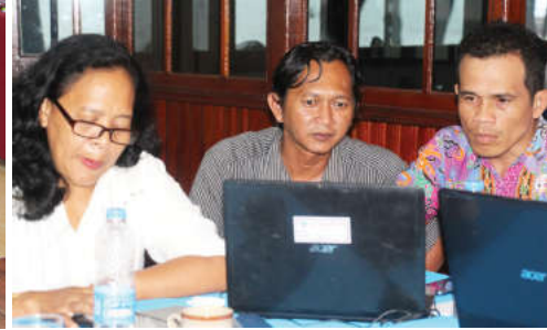
Bussines Plan Palapa Beach Hotel, 14 s/d 19 Nopember 2016

Kegiatan ini diikuti oleh Pengurus, Pengawas dan Manajemen CU Bonaventura serta melibatkan Anggota Potensial dari seluruh Tempat Pelayanan yang ada. Kegiatan ini berlangsung selama sembilan hari terbagi menjadi dua tahapan yaitu Strategic Planning berlangsung selama tiga hari dari tanggal 4 s/d 6 Nopember 2016 di Hotel Dangau Singkawang dan Bisnis Plan berlangsung selama enam hari dari tanggal 14 s/d 19 Nopember 2016 di Palapa Beach Hotel Taman Pasir Panjang Indah Singkawang.