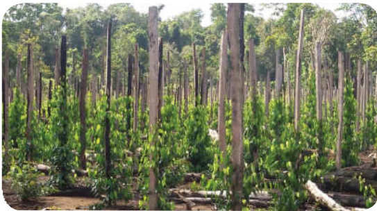
Contoh Tajar atau Ajir

Perawatan dilakukan saat lada berhasil tumbuh dengan baik.