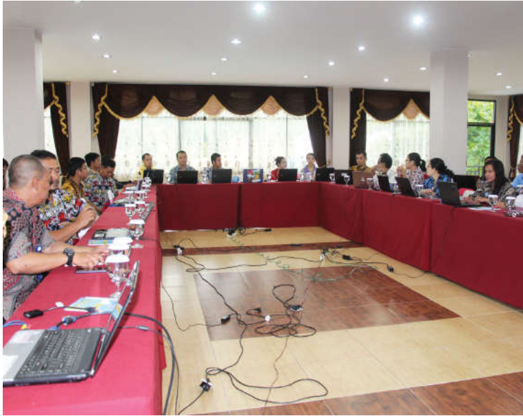
Strategic Planning Hotel Dangau, 4 s/d 6 Nopember 2016