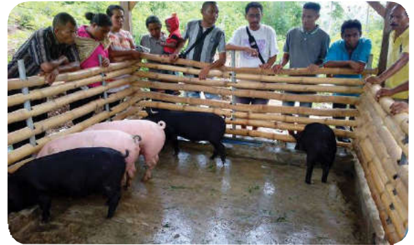
Contoh Kandang Babi

kayu atau ban mobil yang dimodifikasi atau langsung dibeton.