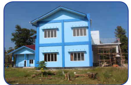
Kondisi Bangunan 90% tanggal 15 Desember 2016